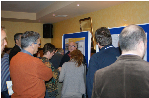
Informatieavond Beekzicht in oktober 2010

Tot slot is er een financiële uitvoeringsparagraaf opgesteld. Hierin staat dat ondernemers bij uitbreidingsplannen óf via het uitgiftecontract óf via de omgevingsvergunning een bijdrage leveren aan het gemeentelijk kostenverhaal. Daarbij valt te denken aan tegemoetkoming in de gemeentelijke plankosten. De provincie Noord-Brabant heeft de TSB eveneens positief beoordeeld. Bent u nieuwsgierig geworden en wilt u hem ook inzien? Hij is terug te lezen op www.zundert.nl > ruimtelijke plannen > thematische structuurvisie.